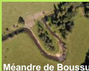
Méandre de Boussu